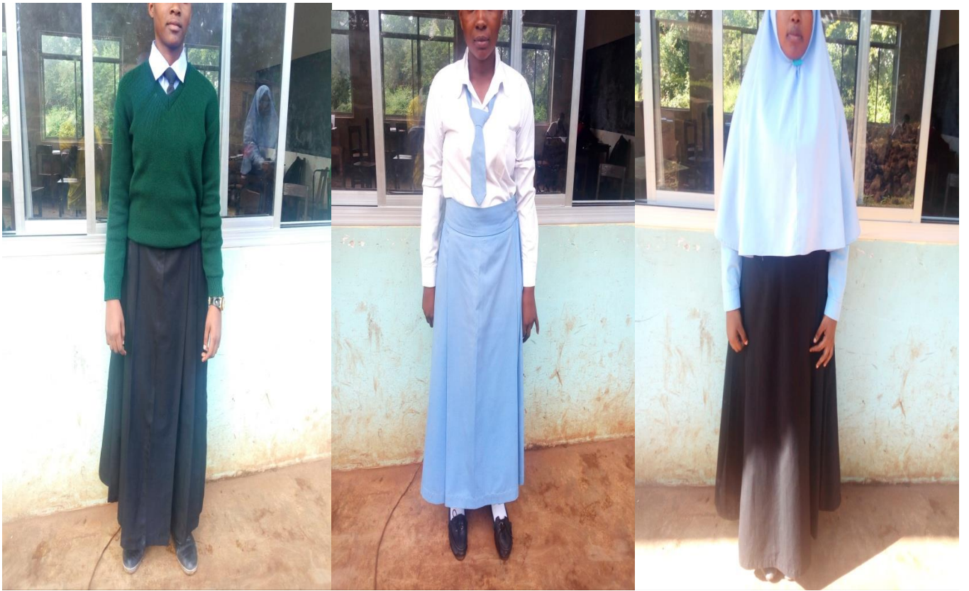
Sare za shule (darasani na nje ya darasa)